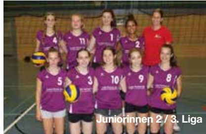
Juniorinnen 2 / 3. Liga