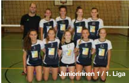
Juniorinnen 1 / 1. Liga