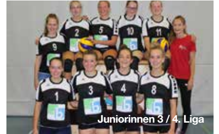
Juniorinnen 3 / 4. Liga