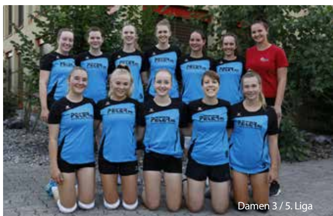
Damen 3 / 5. Liga