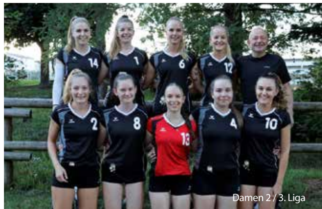
Damen 2 / 3. Liga