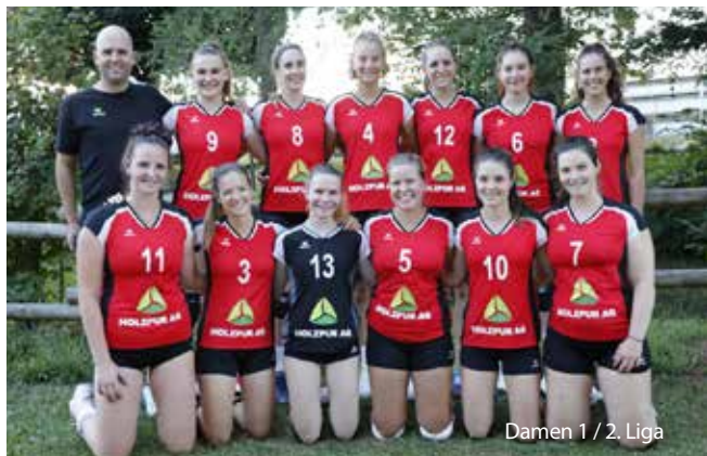
Damen 1 / 2. Liga