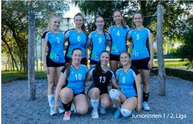
Juniorinnen 1 / 2. Liga