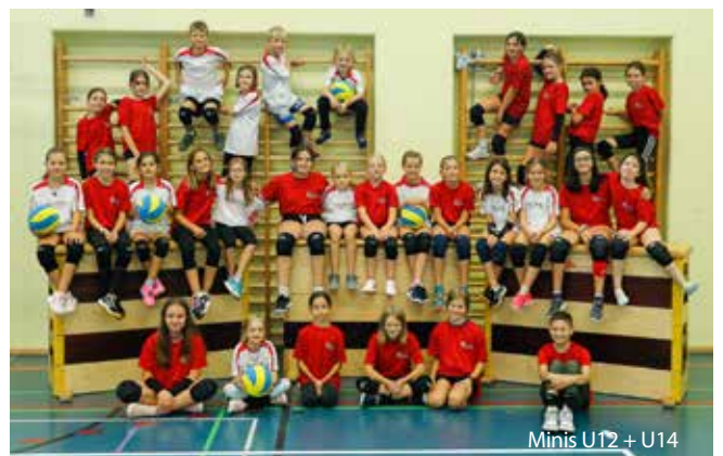
Minis U12 + U14